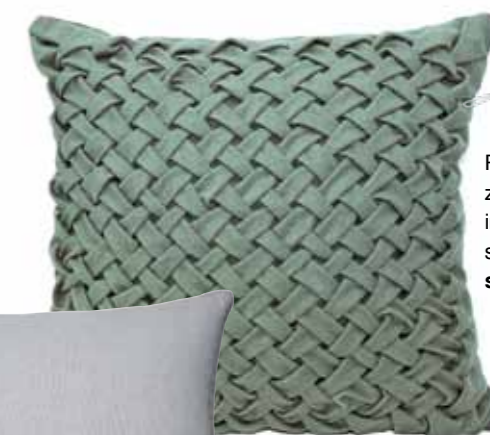
Poduszka z mikrofibry imitującej zamsz, szyta ręcznie, sklep.artidee.pl