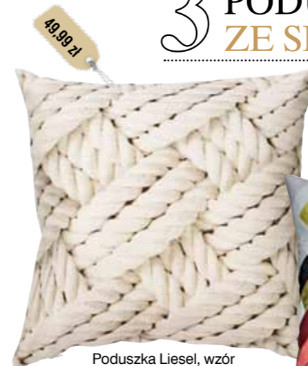
Poduszka Liesel, wzór sznurkowy, 50x50 cm, jasnożółty, IKEA